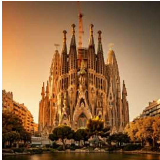
Sagrada Família barcerona spain

มหาวิหารซากราดาแฟมิลี (Sagrada Família): สัญลักษณ์ของบาร์เซโลนาและผลงานชิ้นเอกของเกาดีที่ยังสร้างไม่เสร็จ แต่ก็สวยงามตระการตาด้วยสถาปัตยกรรมที่แปลกตาและรายละเอียดที่ประณีต