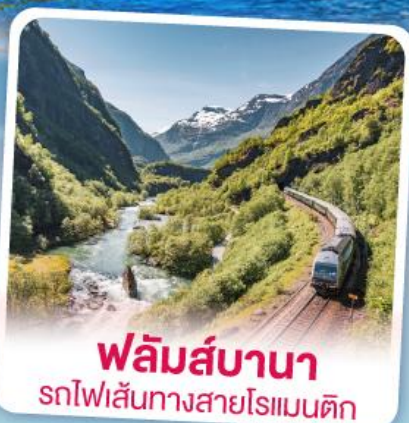
ฟลัมส์บานา รถไฟเส้นทางสายโรแมนติก