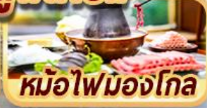
หม้อไฟมองโกล