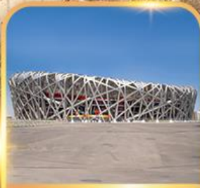
สนามกีฬารังนก