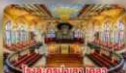
โรงละครปลาส เดลลา มูสิคก้า คาตาลา