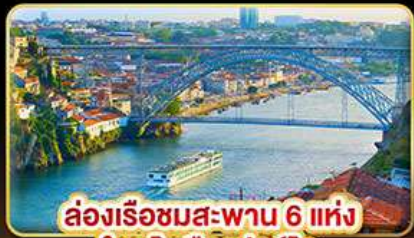
ล่องเรือชมสะพาน 6 แห่ง ในคูโรเมืองปอร์โต