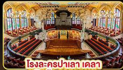
โรงละครปาเลา เดลา มุสิก้า คาคาลานา