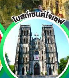
โบสถ์เซ็นต์โจเซฟ