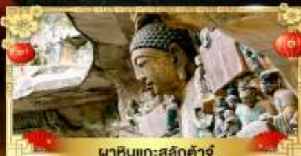
พิพิธภัณฑ์สลักต้าจู่