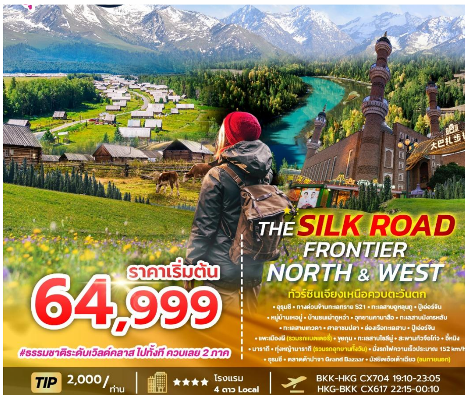
SPHZ-CXJ13 THE SILK ROAD FRONTIER – NORTH & WEST 9 วัน 7 คืน เดินทางด้วยสายการบิน Cathay Pacific (CX)