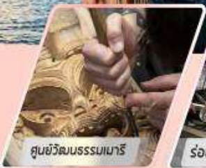
ศูนย์วัฒนธรรมเมารี

เที่ยวเกาะใต้ และเกาะเหนือ : 12 วัน 10 คืน