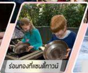
ร้อนท้องที่แซนดี้ทาวน์