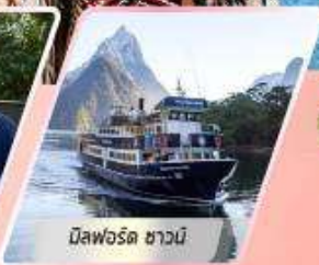
มิสฟอร์ด ซาวนี