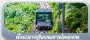
ฟังกรางสูงอดเขาฟลอมอน