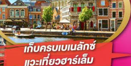
เก็บครบเบเนลักซ์ แวะเที่ยวฮาร์เล็ม