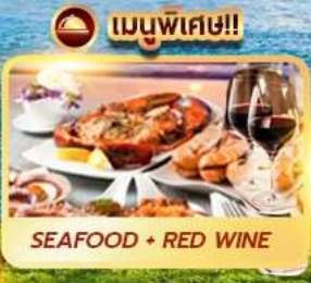
เมนูพิเศษ!! SEAFOOD + RED WINE