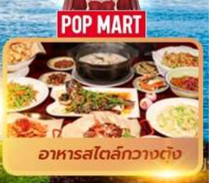
POP MART อาหารสไตล์กวางตุ้ง