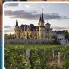
ไรไวน์ จุนยี่ เยียนไก