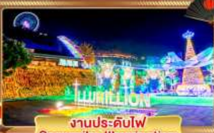
งานประดับไฟ Sagamiko Illumination