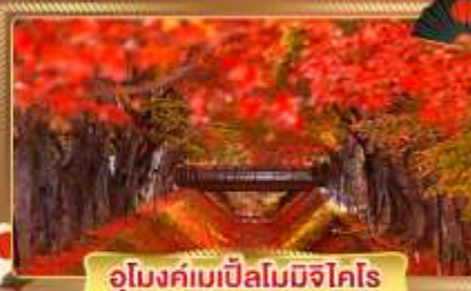
อุโมงค์เมเปิ้ลโมมิจิโคโตะ