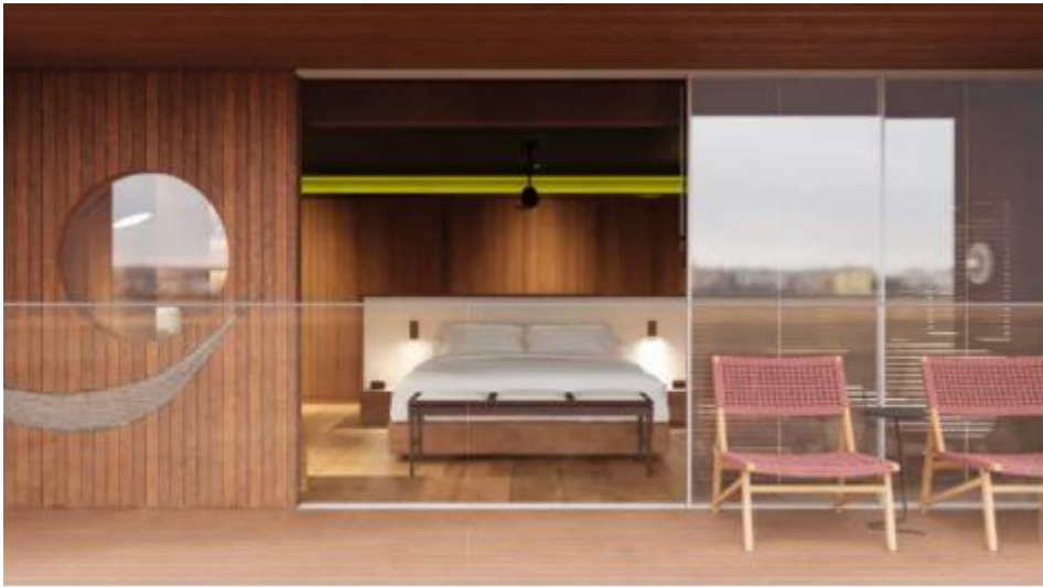
DECK 4 CANOPEE SUITE