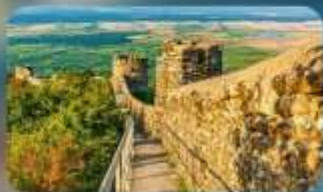
กำแพงเมืองโบราณซิกนาทึ