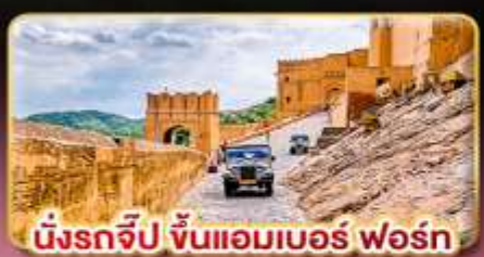
เมืองจิป ขันแอมเบอร์ ฟอรั